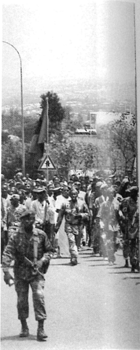
es encadrent les miliciens.