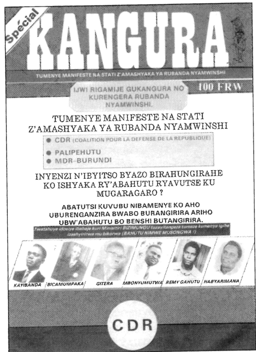
Mars 1992 : édition spéciale de Kangura pour célébrer la création du mouvement extrémiste CDR « Pour faire connaître les manifestations et statuts des partis du peuple majoritaire » CDR au Rwanda, Palipehutu au Burundi.