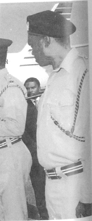
par Yoweri Museveni d'Arusha le 6 avril 1994).