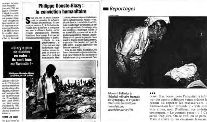
Figure 9 : La communication officielle, vecteur de focalisation du regard sur la mort.