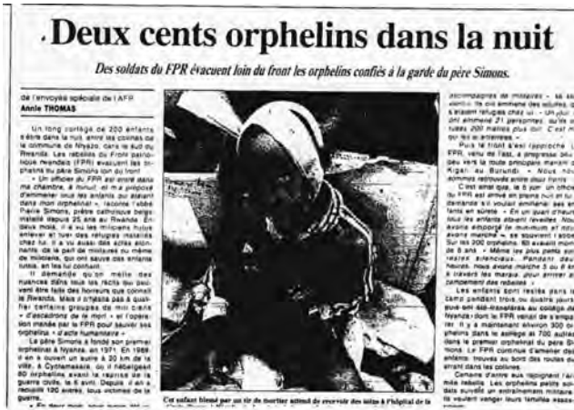
Le Figaro (21/06/94, p. 4).

Au total, deux conclusions principales peuvent être tirées de cette analyse. La première concerne les fortes évolutions tant dans les types de morts représentés que dans les caractères techniques de ces représentations (taille des photographies, cadrage, légende). Si la présence de la mort reste discrète et diffuse y compris en plein génocide ou lors d'affrontements violents entre armées, celle-ci se densifie (nombre, place et taille des photographies) et se diversifie (voir Figure 8) lors de certains moments perçus par la presse comme des temps de crise grave (épidémie de choléra et crise de novembre 1996). Dès lors, le nombre de morts sur le terrain ne paraît plus être le facteur principal expliquant le passage de la mort à la « une » et il apparaît même que certaines réalités ont pu être occultées ou euphémisées (le génocide). Mais l'existence de nombreux angles morts dans les formes de représentation de la mort doit également nous interroger. Comment expliquer l'absence quasi totale de représentations de la mort des militaires et de l'acte de donner la mort (ou de ses tentatives) ? Comment comprendre le peu d'informations apportées par la couverture photographique sur les modes d'extermination, sur l'identité des victimes ou sur les hommages rendus aux morts alors que ces informations sont parfois abordées dans les reportages des envoyés spéciaux. Autant de questions auxquelles l'étude des enjeux des représentations de la mort doit permettre de répondre.