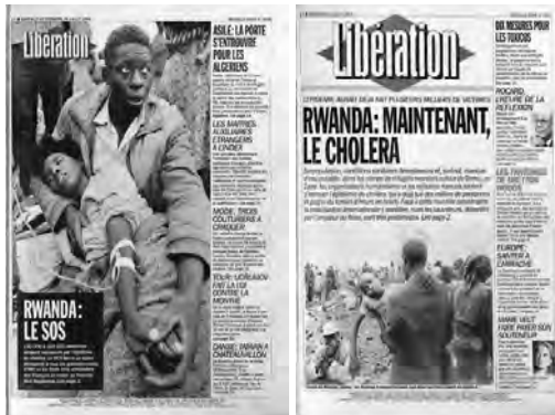
Figure 6 : La mort comme menace : la mort imminente des réfugiés.

À gauche : « Une » de Libération (23/07/94).