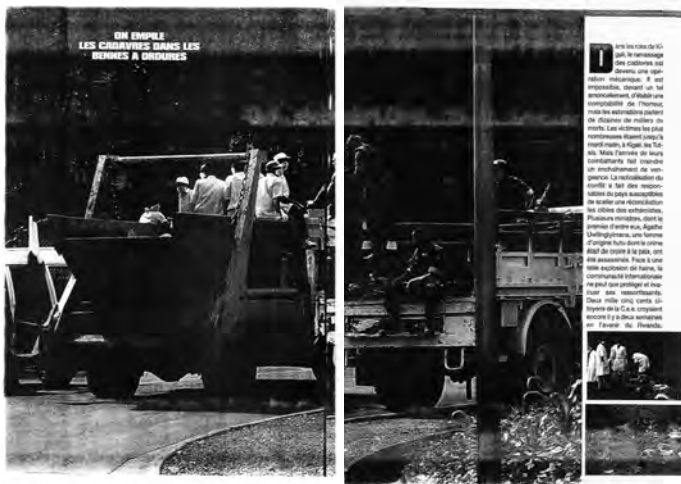
Figure 1 : La présence discrète de la mort de masse au début du génocide.

« Rwanda, la terreur et l'exode », Paris Match , n° 2343 (21/04/94, pp. 60-61).