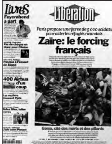
Figure 10 : La mort comme outil de légitimation d'une intervention militaire.

donc pu avoir intérêt à œuvrer dans le sens d'une dramatisation de la situation et d'une focalisation du regard sur les victimes afin de convaincre les opinions françaises et internationales de la légitimité de leur démarche.