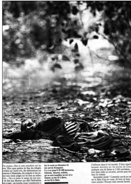
Le Nouvel Observateur (29/05/97, p. 69).

La seconde forme archétypale des représentations de la mort correspond à la mort comme menace pour les réfugiés. Cette thématique est omniprésente lors des conflits des années 90 (Gervereau, 2006) et les conflits des Grands Lacs n'y échappent pas. De manière assez systématique, les réfugiés, et notamment les plus faibles d'entre eux, femmes et enfants, sont présentés comme menacés par une mort incertaine – « la mort en-deçà de la mort » pour Vladimir Jankélévitch (1977) – qui peut revêtir plusieurs formes. Le cas le plus fréquent est la mise en valeur de la précarité de réfugiés dont la mort est encore lointaine, voire hypothétique (première scansion de « l'en-deçà de la mort »). La mort n'est alors présente qu'indirectement sous la forme d'une menace diffuse et sa concrétisation reste sujette à l'interprétation du lecteur. Ce type de cliché très classique (Sontag, 1977) apparaît de manière récurrente mais leur nombre augmente fin mai 1994 avec les clichés des camps de réfugiés de Tanzanie (la menace étant ici les massacres), à la mi-juillet 1994 avec les réfugiés qui fuient vers le Zaïre (la presse souligne les menaces que constituent l'avancée du FPR ainsi que le risque de famine et de maladie) et enfin, entre février et mai 1997, alors que la population rwandaise restée au Zaïre fuit devant l'avancée des troupes de Laurent-Désiré Kabila. Un deuxième temps de « l'en-deçà de la mort » peut aussi être figuré sous la forme d'une mort probable qui se rapproche de plus en