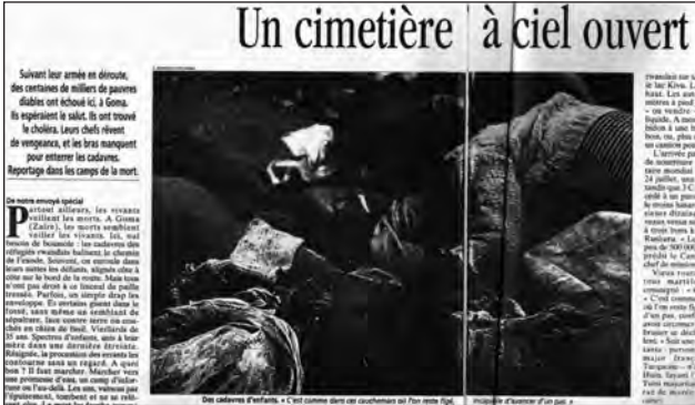
Légende : « Des cadavres d'enfants "c'est comme dans ces cauchemars où l'on reste figé, incapable d'avancer d'un pas" », L'Express (28/07/94, pp.20-21).

Par ailleurs, le thème des fosses communes apparaît dans une scène publiée dans L'Express du 28 juillet 1994 (voir figure 3), que l'on retrouve également dans les éditions du Figaro et de Libération du 22 juillet ainsi que dans Le Point du 30 juillet. Une vingtaine de corps recouverts de lindeuls ont été déposés dans le fond d'un fossé en surplomb duquel se tiennent des réfugiés. Le titre et la légende témoignent de l'alarmisme des humanitaires sur la situation de ces réfugiés encore vivants et mènent le lecteur à voir ici des morts en puissance si bien que « l'en-deçà de la mort » côtoie sur le même cliché « l'au-delà de la mort ». D'ailleurs, sur la plupart des photographies qui représentent la mort de masse fin juillet-début août, les vivants (particulièrement les enfants) ne sont jamais bien loin des morts. Ainsi, dans un des rares exemples de mise à la « une » de « l'au-delà de la mort », Le Figaro du 22 juillet 1994, présente-t-il cette même scène avec au premier plan une petite fille qui regarde l'objectif.