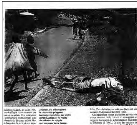
Figure 5 : La mort comme menace : des réfugiés au milieu des morts.

À Gisenyi, des enfants fuient la canonnade qui oppose les troupes rwandaises aux unités zairoises, jetées sur les routes, des colonnes de réfugiés sont menacées par la famine.