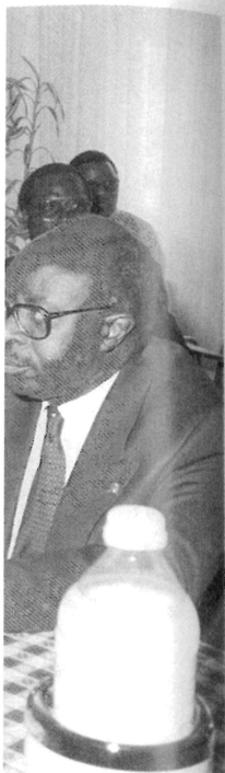
u, président du MDR 1 du parti libéral.