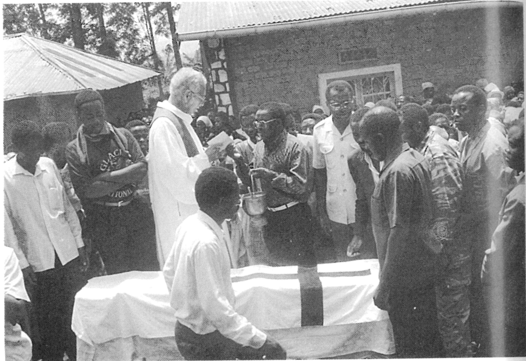
Obsèques de Fidèle Rwambuka. A l'extrême droite, Laurent Semanza, bourgmestre puis député de Bicumbi, membre des Escadrons de la mort, parent par alliance de Nzirorera.