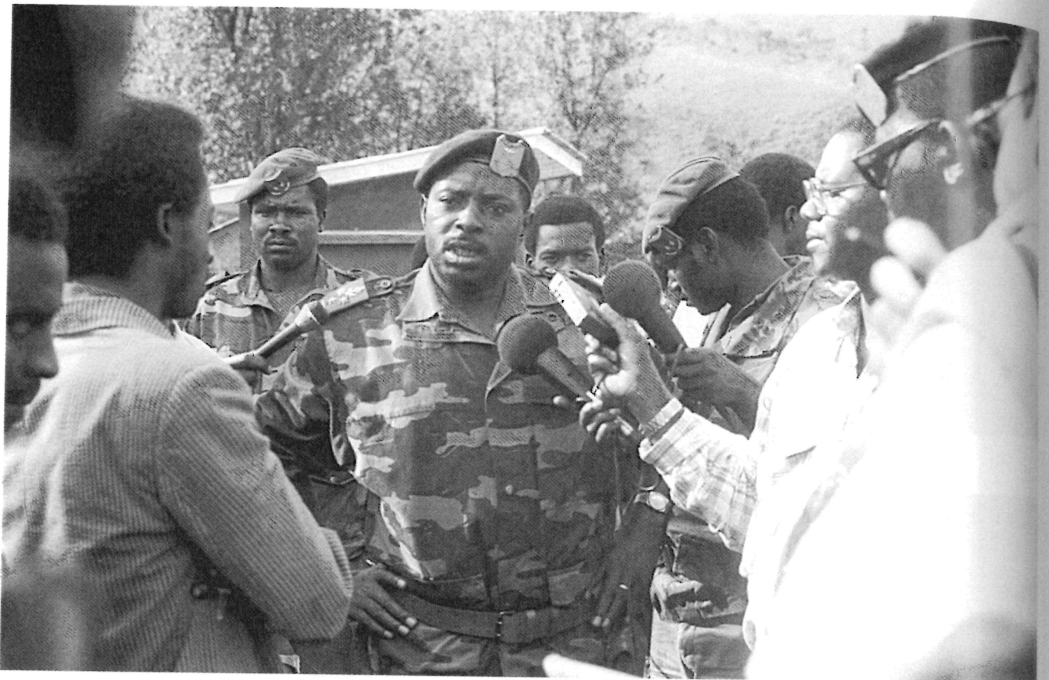
Visite de la presse nationale dans la zone de combat, le 30 mai 1991. Au centre, le colonel Déogratias Nsabimana, commandant des opérations. Promu chef d'état-major des FAR, il périt dans l'attentat du 6 avril 1994.