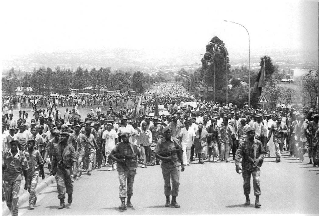
Marche de soutien aux FAR par les militants du MRND. Des militaires encadrent les miliciens.