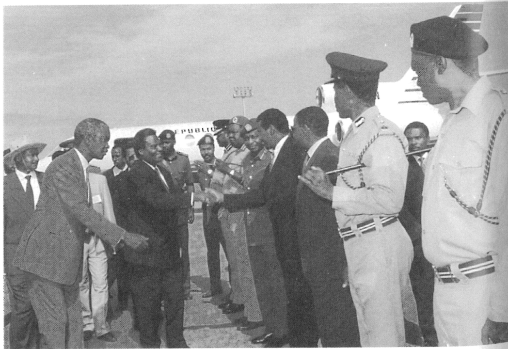
Août 1993 : le président Habyarimana accueilli en Ouganda par Yoweri Museveni pour la signature définitive des accords de paix d'Arusha (au fond, l'avion Falcon présidentiel qui sera abattu le 6 avril 1994).