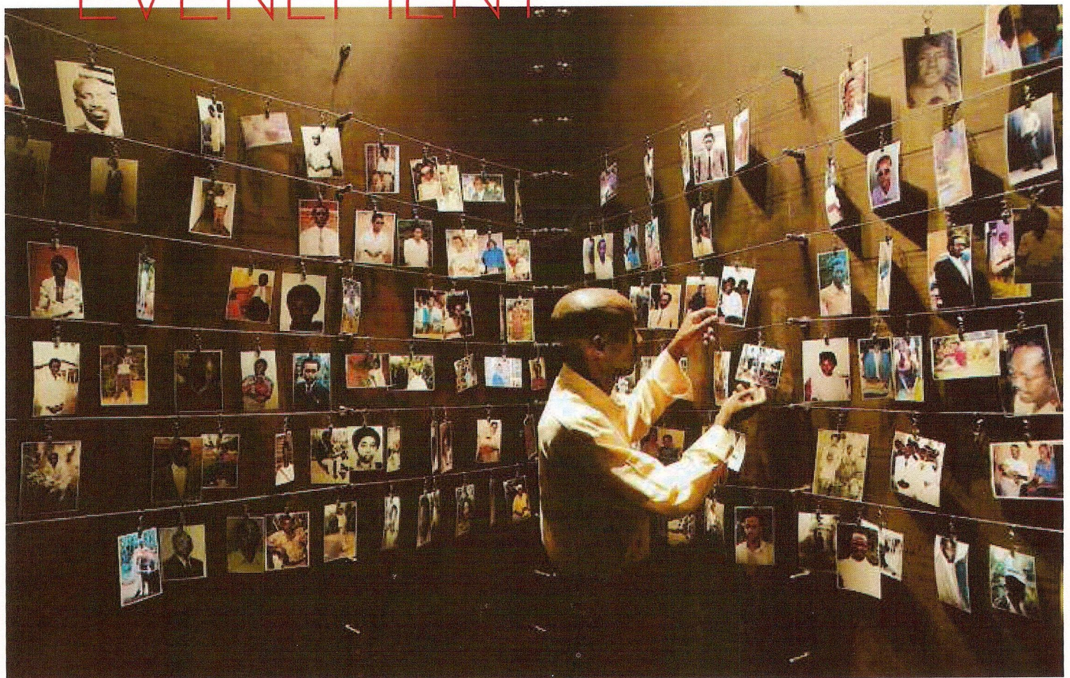
Un survivant devant des photos de victimes du génocide rwandais, en 2004, au mémorial Gisozi, à Kigali. 800 000 personnes ont été tuées entre avril et juillet 1994.

Seize ans après le génocide, la visite du président français à Kigali aujourd'hui marque la détente entre les deux pays. Avec ou sans mea culpa.