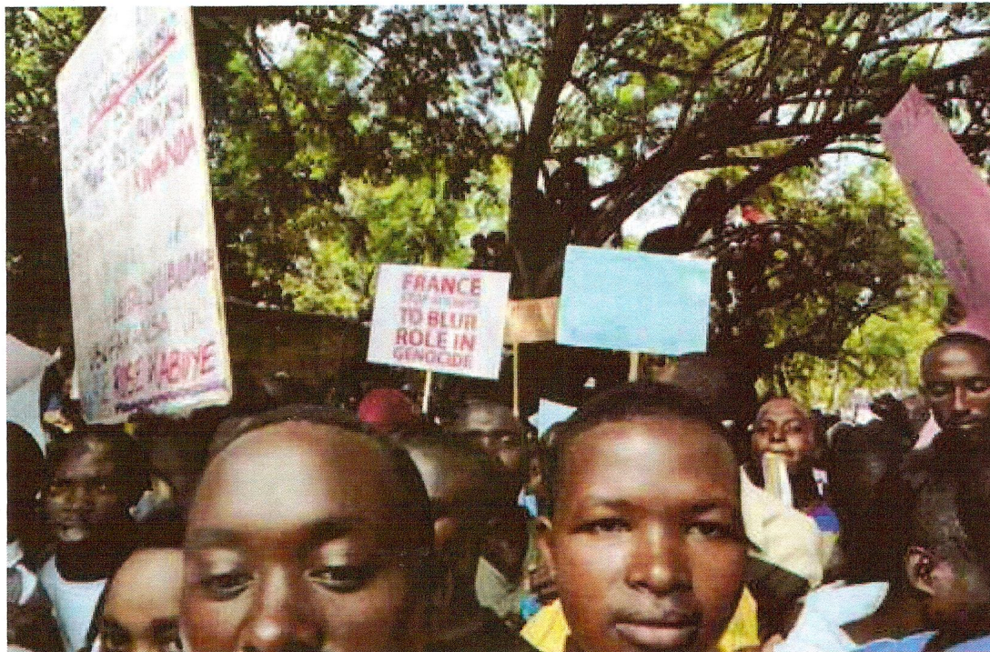
Manifestation à Kigali, en novembre 2008, pour protester contre l'arrestation de Rose Kabuye en Allemagne.

La venue de Sarkozy ne signe pas la fin des litiges juridiques et économiques.