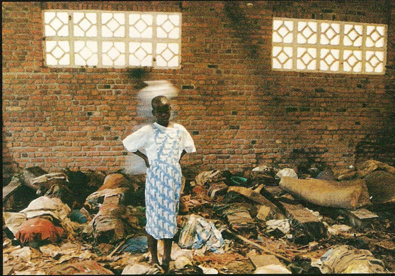
Fuyant les milices hutues, dix-huit mille Tutsis s'étaient réfugiés dans cette église de Kigali, espérant ainsi échapper au massacre. Ils n'imaginaient pas que certains prêtres avaient fait alliance avec leurs bourreaux.