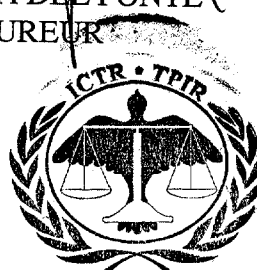
CARLA DEL PONTE PROCUREUR