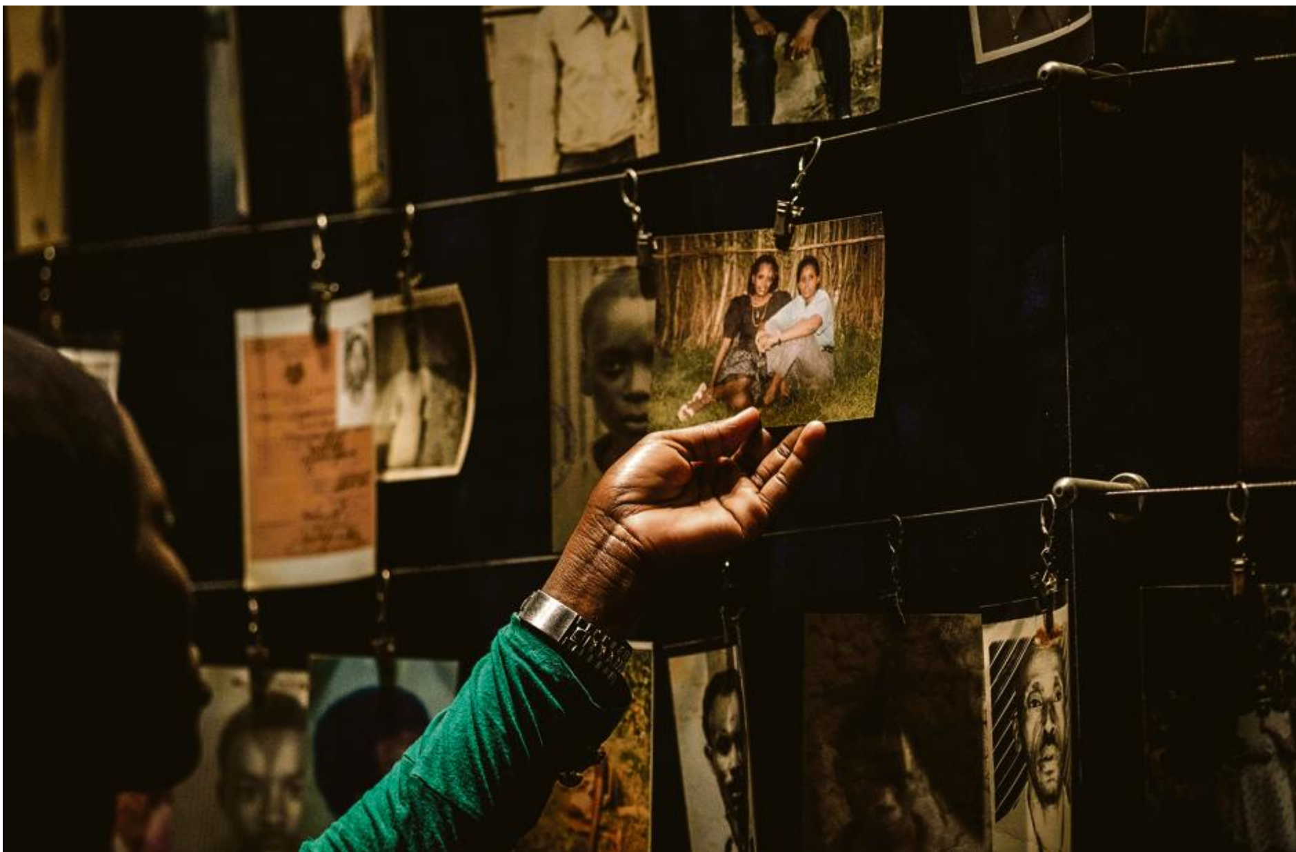
Des photos de victimes, au Mémorial du génocide de Kigali, en avril 2018.