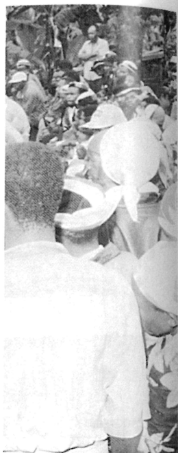
le la CDR, lynché par la gauche (veste sombre, stre de la Défense.