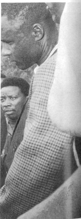
ministre de la Santé it de l'Akazu. député Munyampundu. eze.