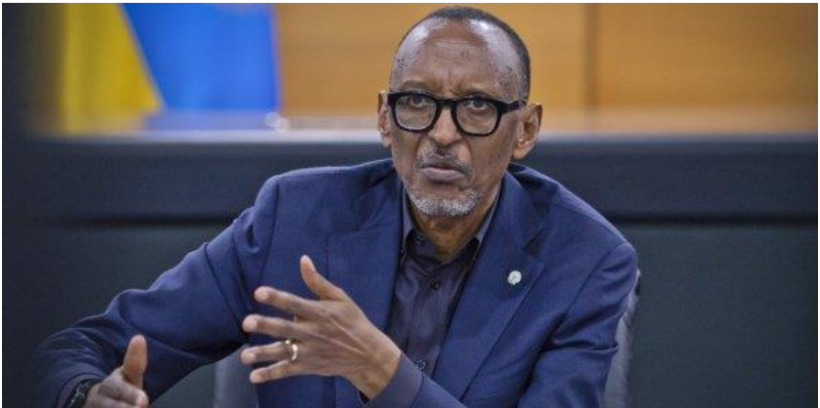
À Kigali, pendant l'interview accordée à JA, le 20 janvier.