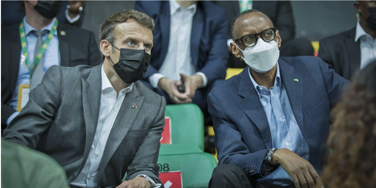
Emmanuel Macron et Paul Kagame, à Kigali, lors de la visite officielle du président français, le 27 mai 2021.