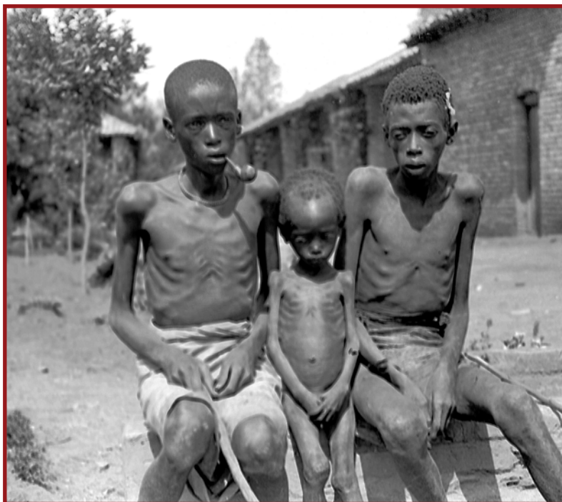
Ci-dessus et ci-contre : photographies d'affamés qui se sont présentés à la mission de Kabgayi pour bénéficier des secours des missionnaires Pères Blancs. (Société des Missionnaires d'Afrique/Pères Blancs, Photos Service, Namur).

seconde nécessité, comme les houes, les habits, les perles, etc., contre des vivres. D'autres en seraient même arrivés à troquer les piliers en bois de leur case pour de la nourriture.