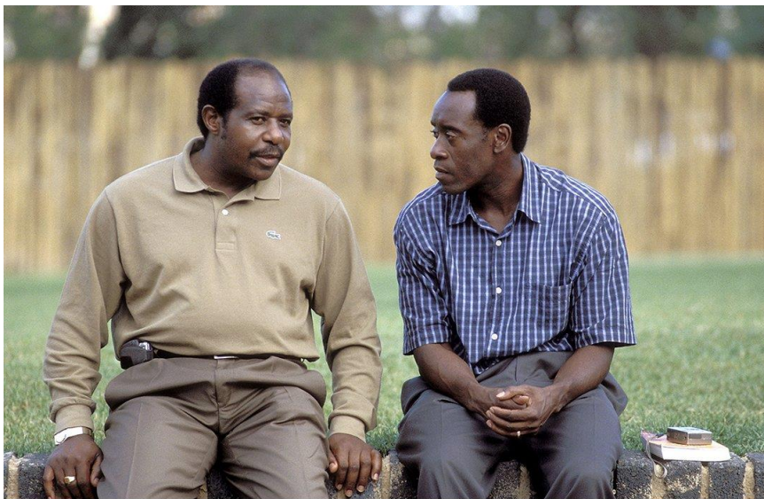
Paul Rusesabagina et l'acteur Don Cheadle sur le tournage de « Hotel Rwanda » (2004), de Terry George