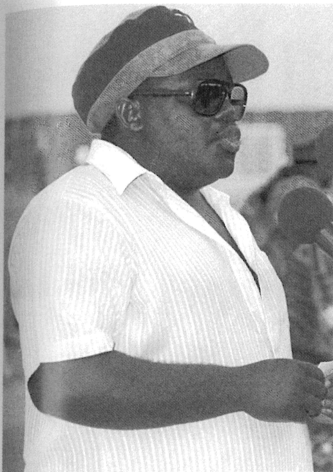
Georges Rutaganda, vice-président des Interahamwe, photographié à la manifestation du 4 janvier 1992.