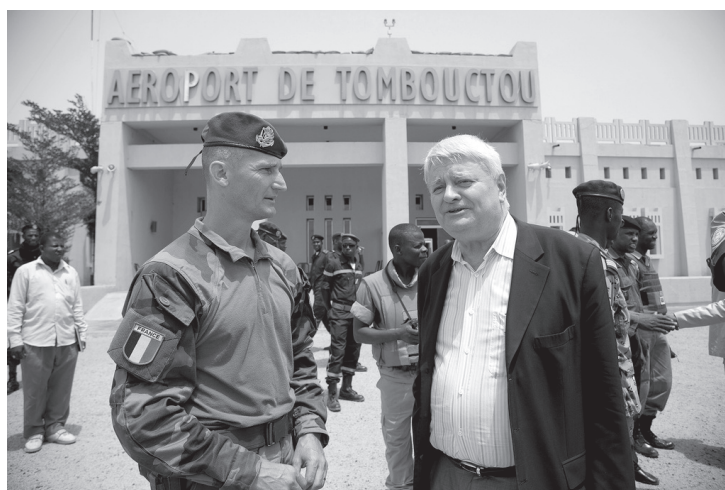
Le français Hervé Ladsous, à la tête du Département des opérations de maintien de la paix à l'ONU, en visite au Mali le 30 juin 2013

concertation avec les responsables de Serval » 3 . Le pays ne contribue donc pas pour ce qui est des troupes de bases, mais se taille la part du lion dans l'état-major, jusqu'à le diriger. En plus de cela, le « lien » opérationnel avec Serval est assuré : « La force Serval a mis en place des détachements de liaison et d'appui (DLA) au sein [des] bataillons [de la MINUSMA]. Ils sont sous commandement français et ont pour mission de veiller à