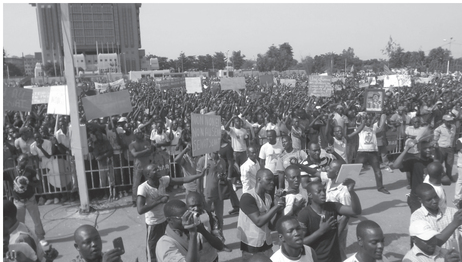
Manifestations à Ouagadougou le 28 juillet 2013

Les politiques français s'entêtent à chanter les louanges du dictateur burkinabé au pouvoir depuis 1987 et sa collaboration à la guerre française au Mali n'a rien arrangé. Pourtant le leader de l'opposition ne devrait pas inquiéter les intérêts français, alors que le régime se trouve en grande difficulté