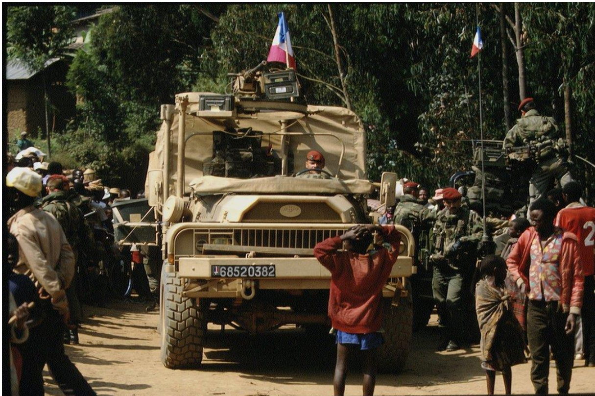
« Turquoise », une opération militaire française au Rwanda mandatée par les Nations unies.

Toutefois, selon notre source, « le rapport fournit des analyses détaillées et inédites – car croisant de très nombreux documents – sur les principaux sujets qui ont cristallisé les interrogations au sujet de l’engagement de la France entre 1990 et 1994, qu’il s’agisse des livraisons d’armes au régime rwandais, de l’engagement opérationnel auprès des Forces armées rwandaises ou de différents épisodes comme le massacre de Bisesero en [juin] 1994 ou la non-arrestation du gouvernement intérimaire rwandais dans la Zone humanitaire Sud [alors contrôlée par l’armée française] ».