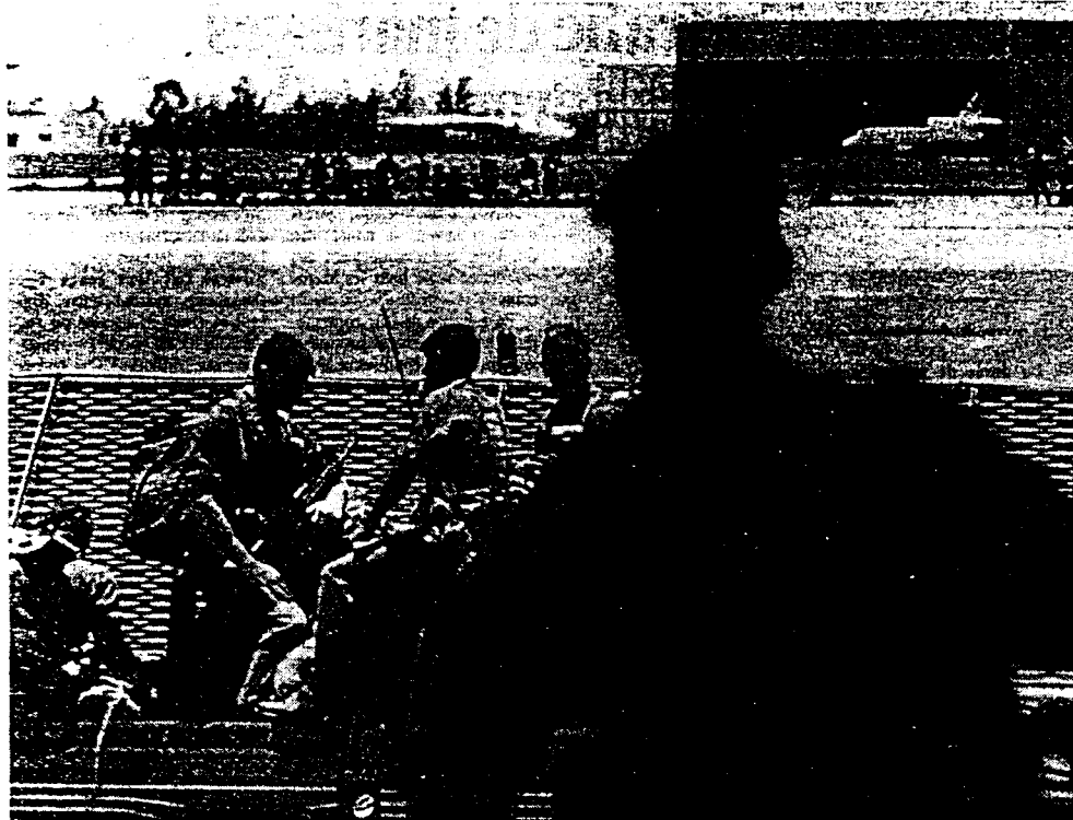
Soldats français contrôlant l'aéroport de Kigali : en un combat douteux.

Dès la publication de ce rapport la Belgique — ancienne puissance coloniale au Rwanda — a rappelé son ambassadeur à Kigali, le gouvernement belge a convoqué l'ambassadeur du président Habyarimana à Bruxelles. Paris faisait la sourde oreille.