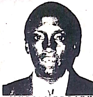
MURI MERDIEN INKOTANYI ZALI ZIVUGANYE UMUKOZI WAHU